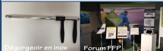
Dégorgoir en inox

Plusieurs types de dégorgeoirs ont été testés par la profession dans l'objectif de libérer plus rapidement l'hameçon des requins et des raies.